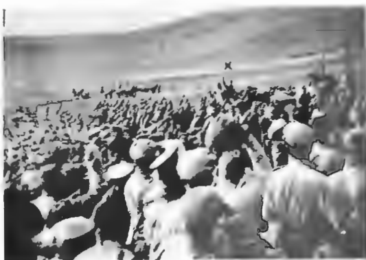
Смотръ революціонной арміи. ( × Керенскій ).