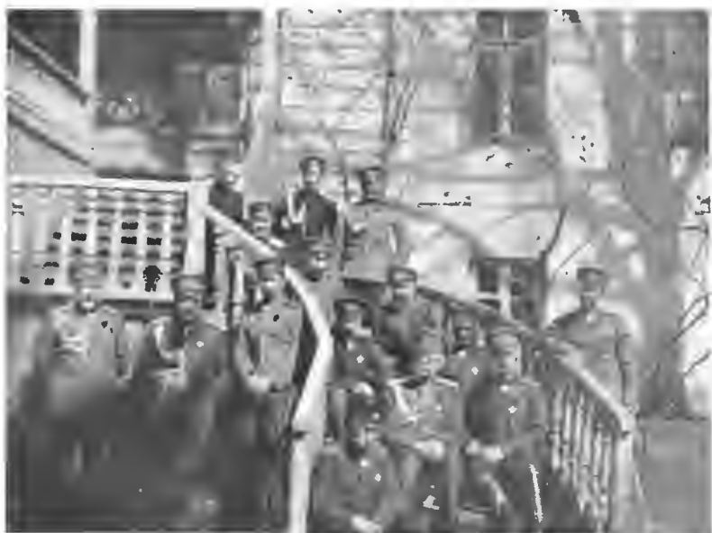
На съѣздѣ главнокомандующихъ.

Деникинъ. Даниловъ. Ханжинъ. Духонинъ. Драгомировъ. Егорьевъ. Гурко Алексѣевъ. Щербачевъ. Брусиловъ