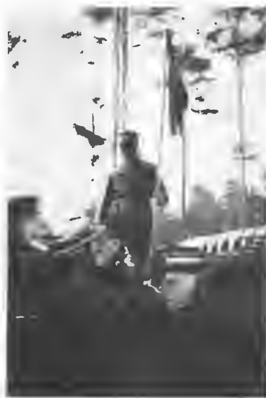
Керенскій на солдатскомъ митингѣ.