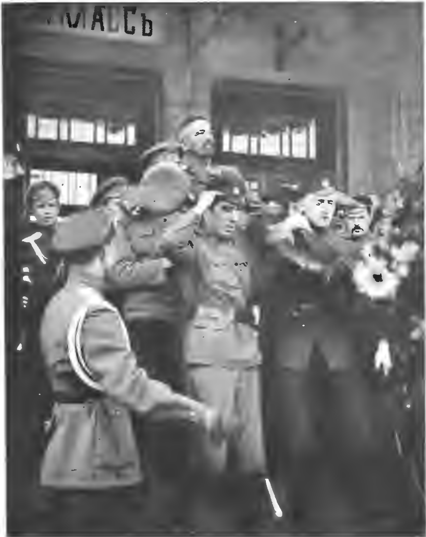
Встрѣча ген. Корнилова въ Москвѣ.