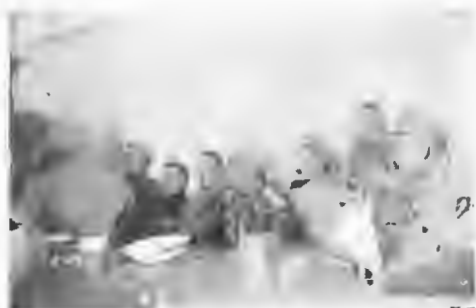
Походное офицерское собраніе.