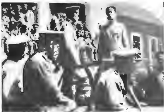
Комитетъ привѣтствуетъ ген. Брусилова.