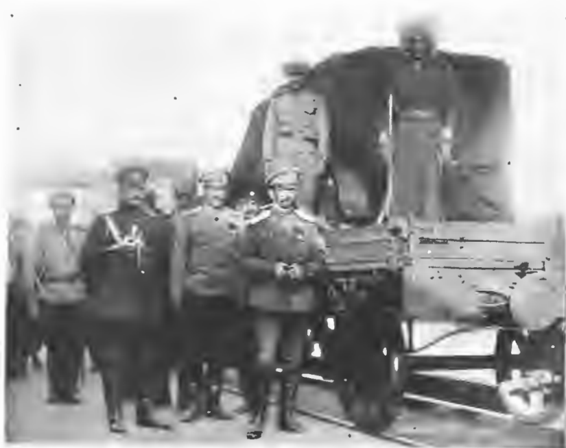
Пріѣздъ ген. Корнилова въ Москву на Государственное Совѣщаніе.