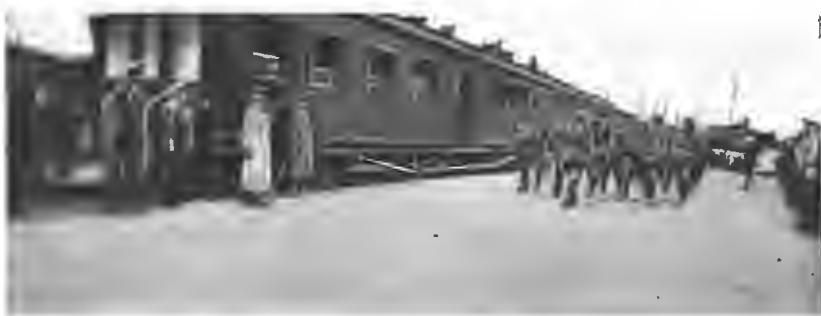
Встрѣча ген. Брусилова въ Ставкѣ.