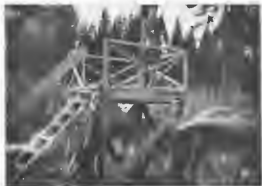
Керенскій на солдатскомъ митингѣ.