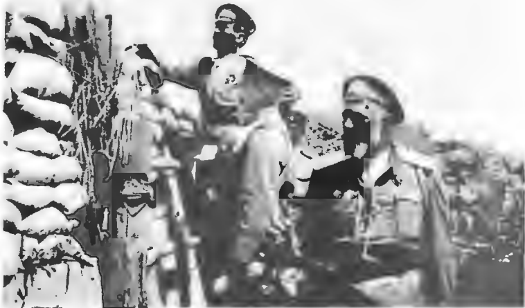
Генералъ Корниловъ въ окопахъ.