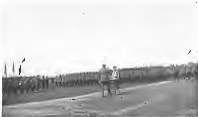
Смотръ въ старой арміи ( × ген. Н. І. Ивановъ ).