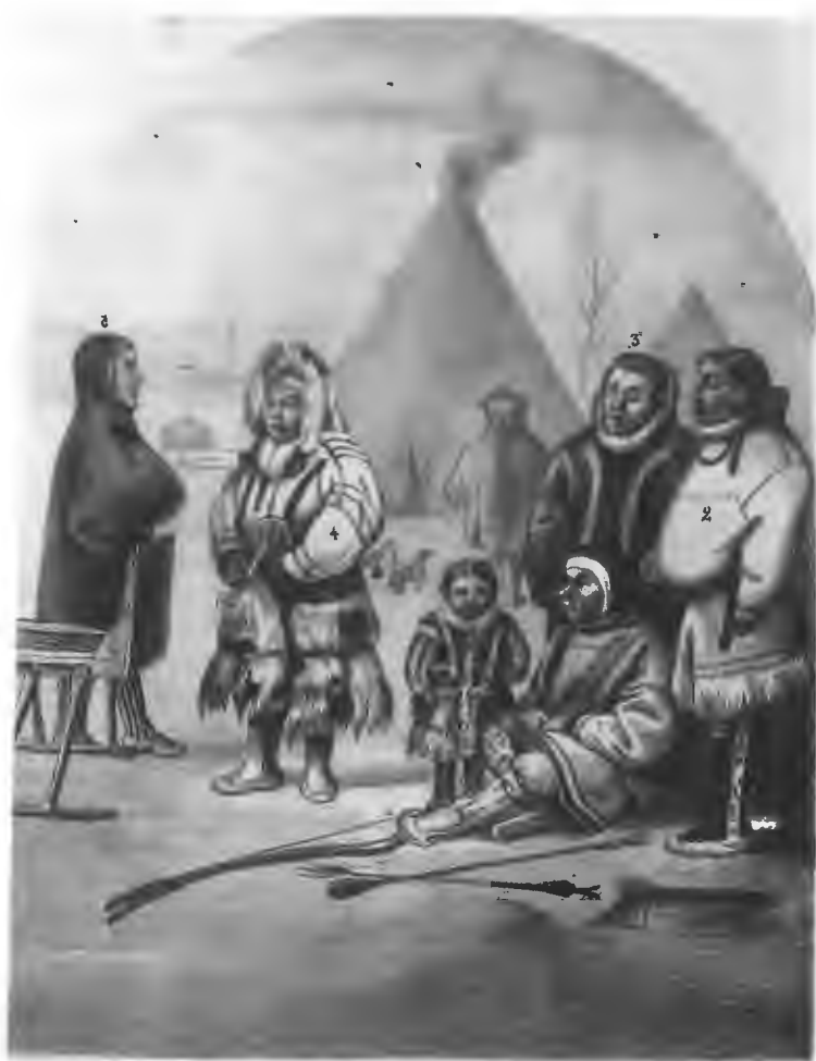
Типы кочующих Остяков-олениводовъ въ самоѣдскихъ тундрахъ. 1) Старшина Аниго, 2) Старшина Калевъ, 3) Помощникъ князя Юрій Юрьевичъ Ромымавъ, 4) Остячка жена Самоѣда Нячи, 5) ра- ботникъ Уйво