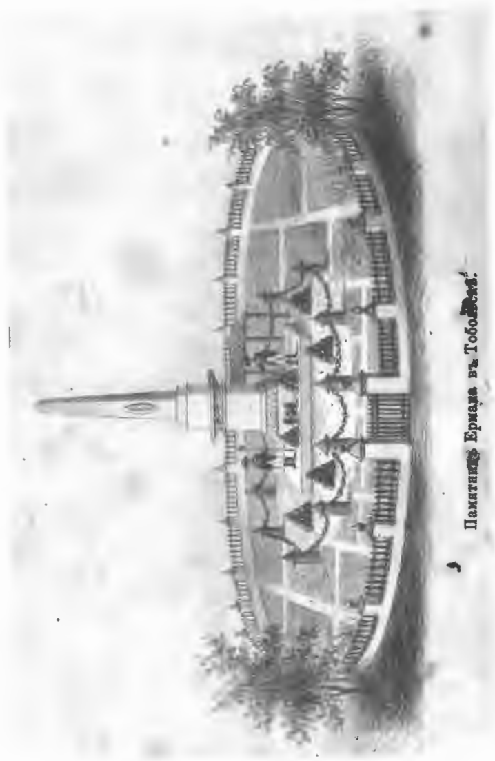
Памятник Ермаку въ Тобольскѣ.