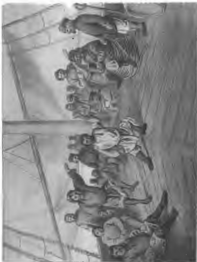
Пирь на лквудъ "Тазь", близъ мыса Кочующій въ Тазовской губь.