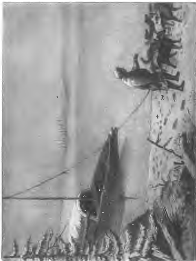
Путешествие вверх по р. Енисею.