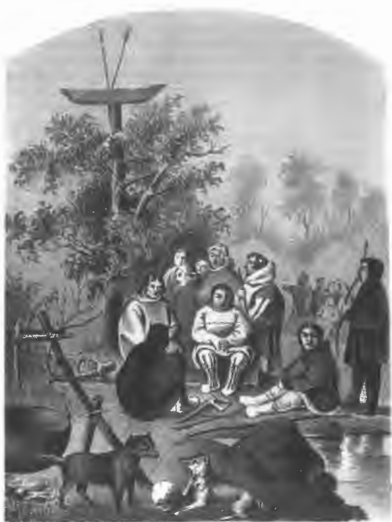
Миръ заключенный между Самофдами и Остиками, послѣ продолжительной войны.