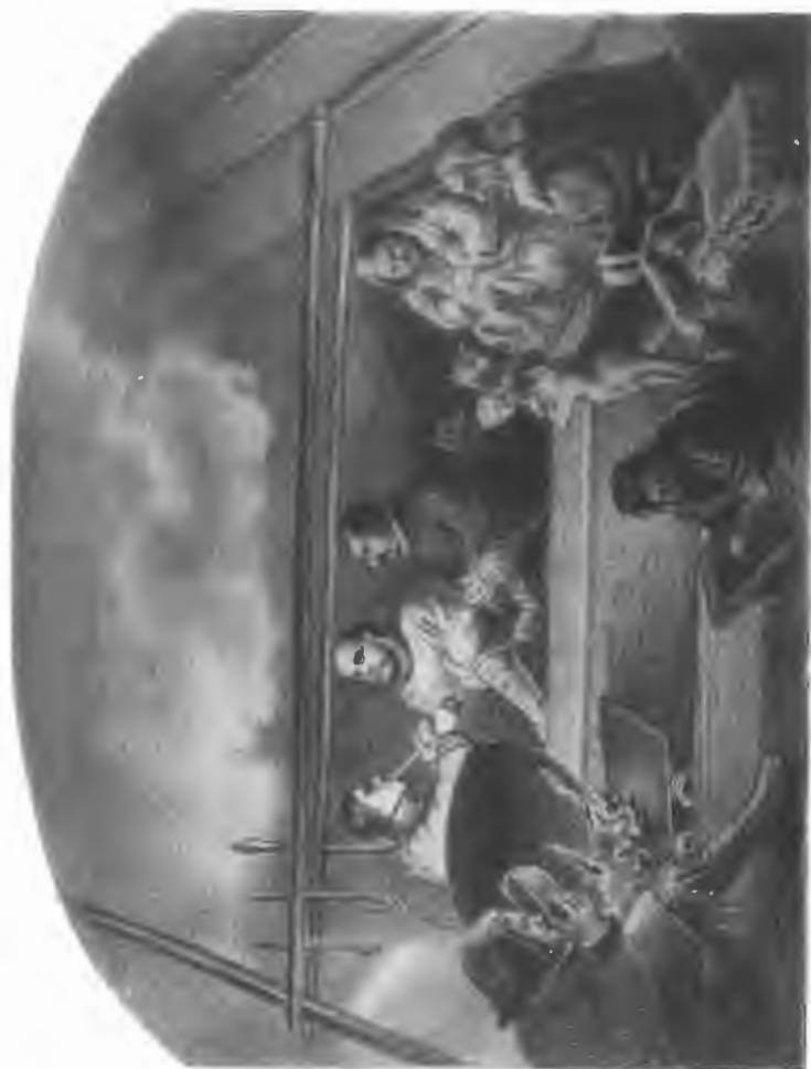
Внутренний бытъ Самоэдовъ въ чуму.