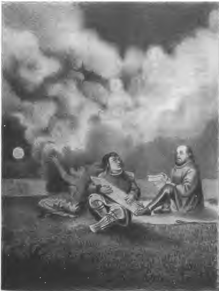
Разказъ Самоѣдина Тярка о сотвореніи міра, паденіи Самоѣда и на- казаніи его дьяволомъ болѣзней оспою.