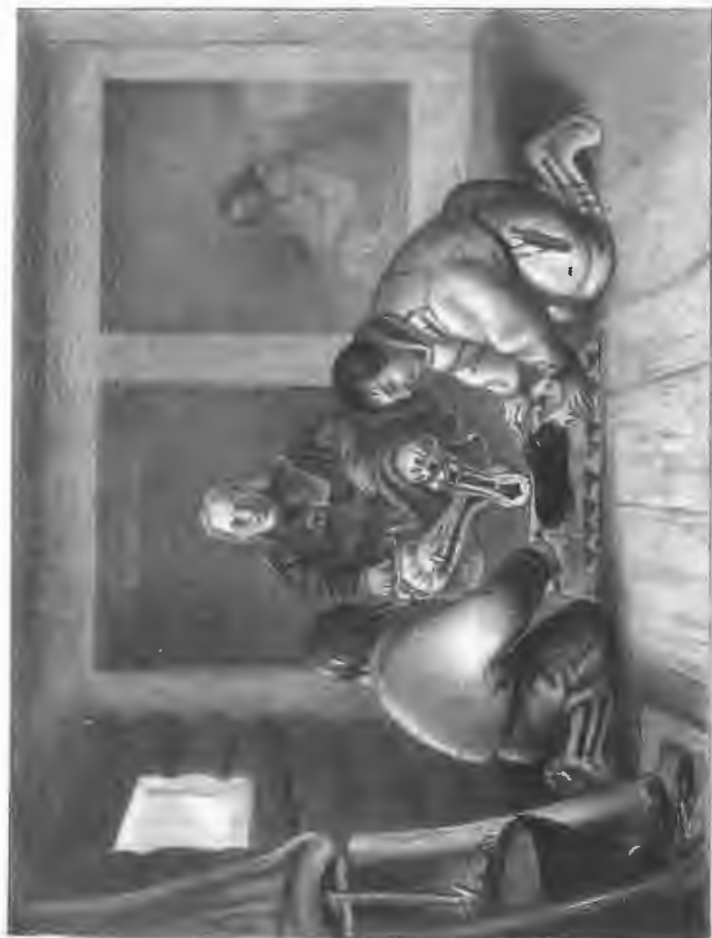
Самодель и остатки назъ Тайшия приводятъ къ присягѣ Са- модель, не сознавъся въ кражѣ оленей.