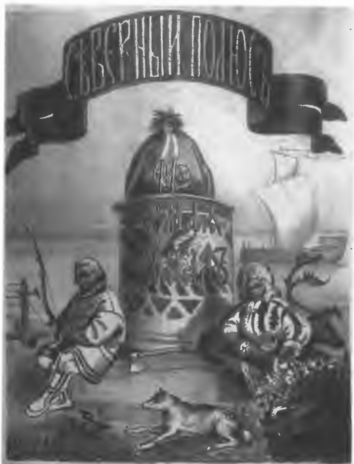
Съ Самоѣдскій идолъ Ортикъ на память р.Худ.

Печатано въ Типогр. и Литогр. К. Штремера, въ С ПЕТЕРБУРГѢ.