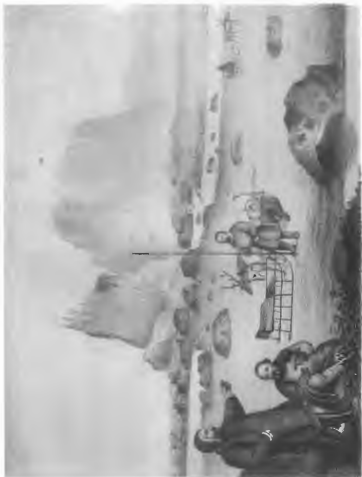
На Уральских горахъ Войкарская долина, разделяющая системы рѣкъ Обскихъ и Печерскихъ.