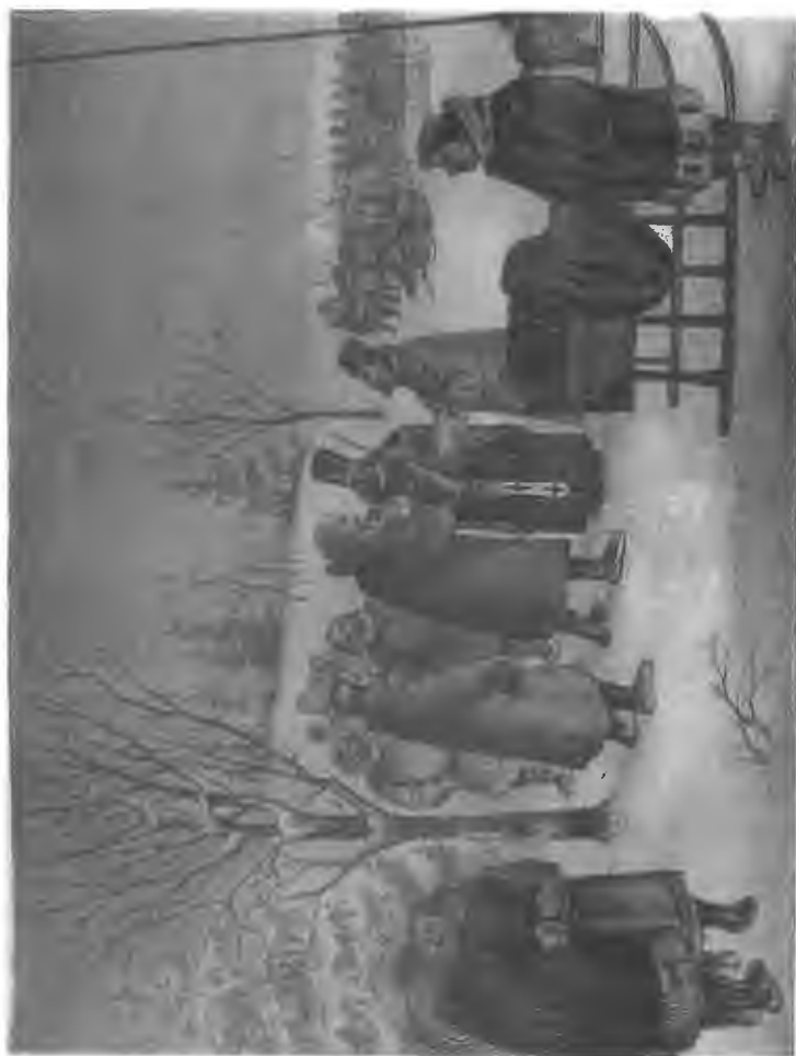
Выезд экспедиции из окрестностей Обдорска для отыскания сухопутного сообщения р. Енисея с р. Обью через самодские тундры.