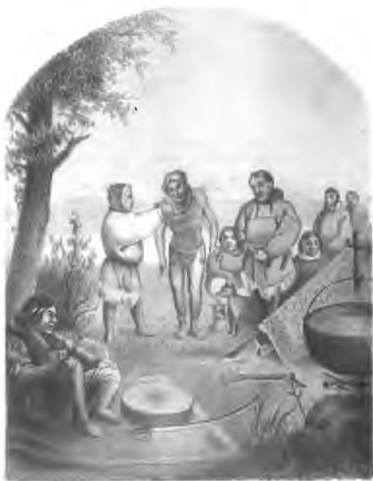
Самоѣдъ, удрученный льгами, передаетъ себя въ жертву, при шаманствѣ племени своемъ, для счастливѣйшаго ихъ быта на землѣ.