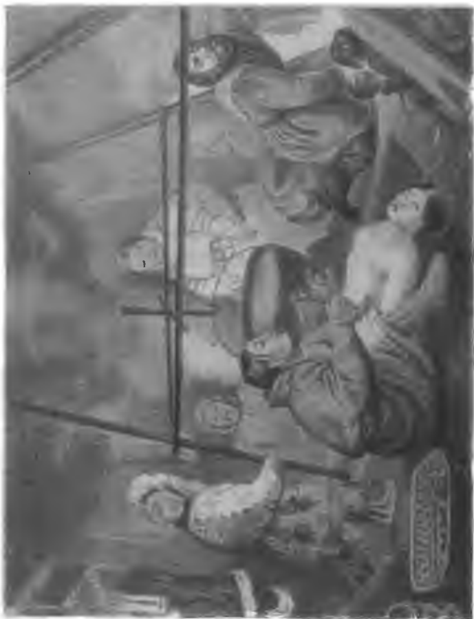
Угощені Сопника Какаула самодіями, родоначальником