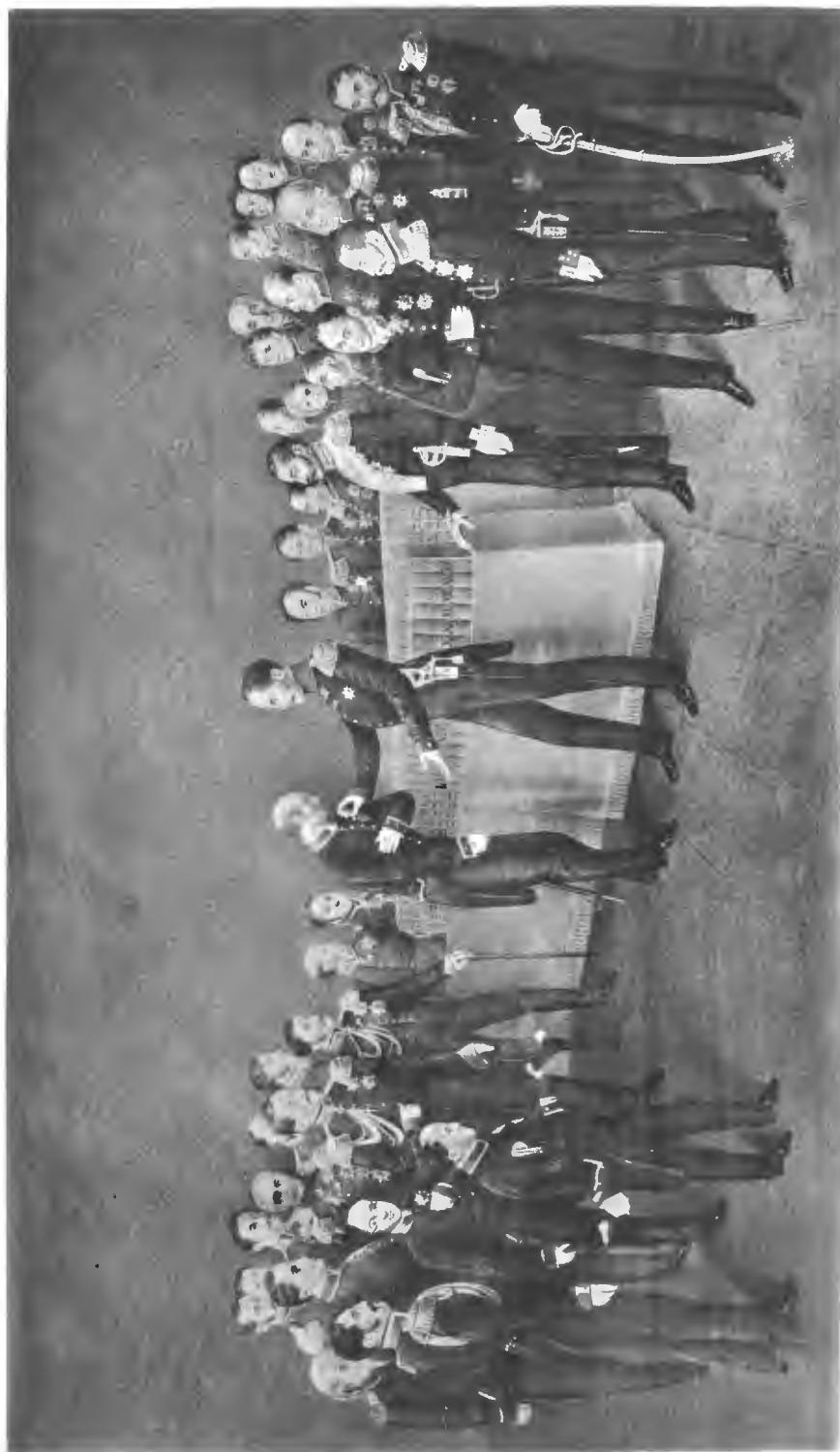
4-го Генералъ Шерра, Высочайшій Ръ Мобильн