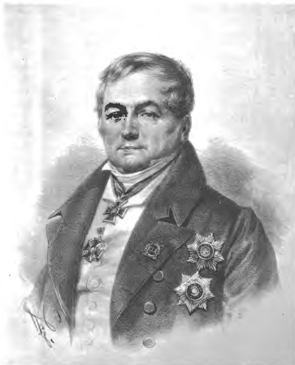
Фото Гравюра Шереръ НабгольцъиНъ въ Москвѣ.