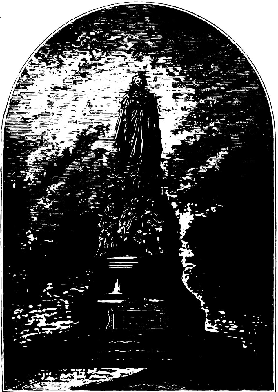
ИМПЕРАТРИЦЪ ЕКАТЕРИНЪ П-я ВЪ ЦАРСТВОВАНИЕ ИМПЕРАТОРА АЛЕКСАНДРА П-го 1873 г.